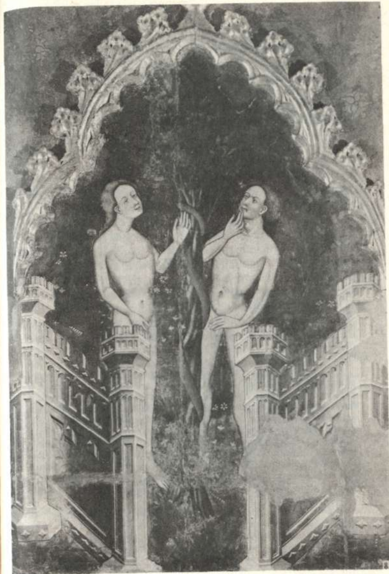
El pecado original. Pintura sobre tabla, por Ramón Mur, procedente del retablo mayor de Guimerá Museo Episcopa, Vich

Si no pone primero en claro lo que significa «pecado», de poco aprovecha decir del pecado que es lo egoísta. «Ego» significa precisamente la contradicción de que lo universal sea puesto como lo individual. Sólo cuando está dado el concepto